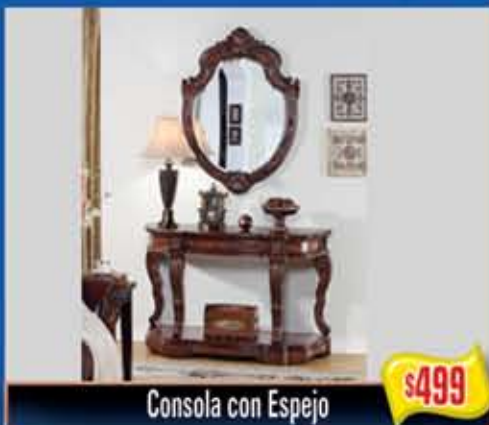
Consola con Espejo