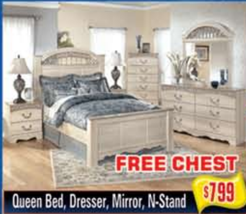
Queen Bed, Dresser, Mirror, N-Stand