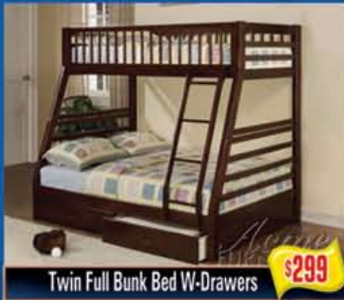
Twin Full Bunk Bed W-Drawers