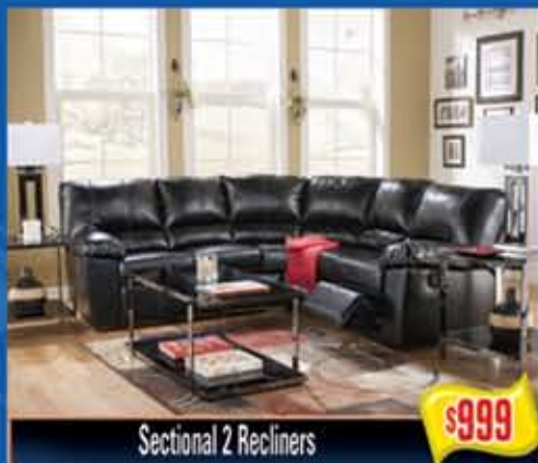
Sectional 2 Recliners