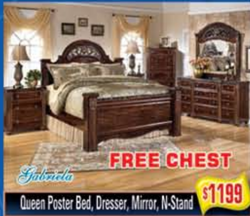
Queen Poster Bed, Dresser, Mirror, N-Stand