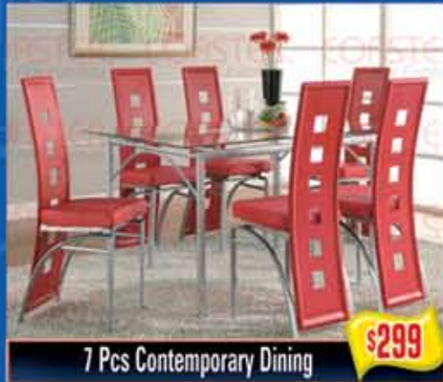
7 Pcs Contemporary Dining