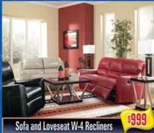
Sofa and Loveseat W-4 Recliners